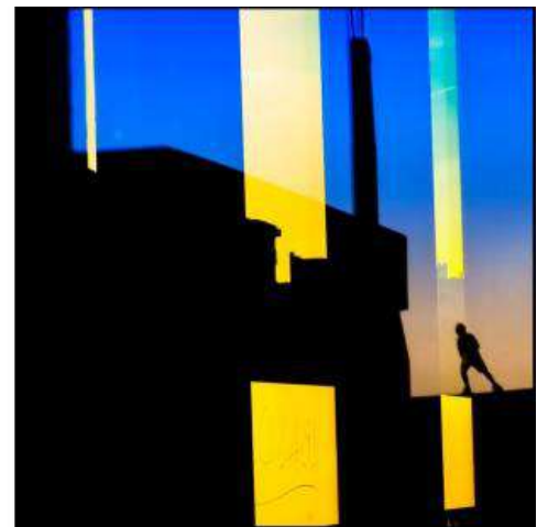
Primer Premio XVI Edición: Ulises Salom